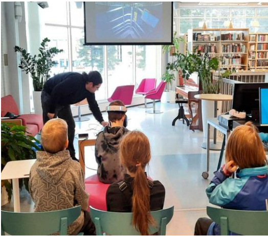
Pelipäivässä kokeiltiin VR-laseja

Mäntän kirjastossa toimii Taidelainaamo yhteistyössä Mäntän Taideseuran kanssa.