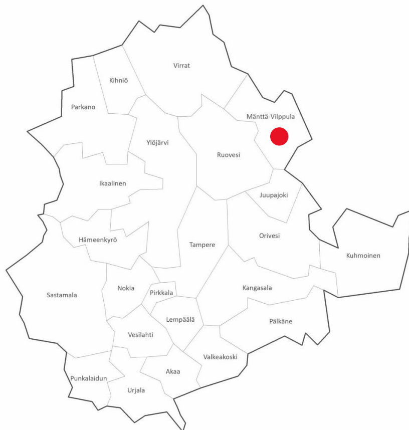
Kuvio 1: Mänttä-Vilppulan sijainti Pirkanmaalla. (Kartta © Maanmittauslaitos)

Mänttä-Vilppulan kaupunki on noin 9300 asukkaan kaupunki Koillis-Pirkanmaalla, noin 90 kilometrin päässä Tampereelta ja Jyväskylästä. Kaupunki tunnetaan laajasti myös nimellä Taidekaupunki, sillä kaupungissa sijaitsevat Serlachius-museot Gustaf ja Gösta. Museoiden lisäksi kaupungissa järjestetään etenkin kesäisin runsaasti taide- ja kulttuuritapahtumia, joista tunnetuimpia ovat muun muassa Mäntän Musiikkijuhlat, Kuvataideviikot ja Mänttä Food Festival. (Mänttä-Vilppulan kaupunki 2024.)